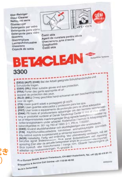
ウェットドライ拭き取りタイプ (8ml)

3. 腐食があれば金属面が現れるまでフレンジを磨き、プライマーを塗布前に BETACLEAN 3300 で拭く。