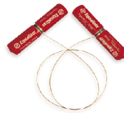
品番:TWH500 商品名:ハンドグリップ 参考価格:¥4,400