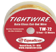
品番:TW72 商品名:タイトワイヤー 参考価格:¥2,000