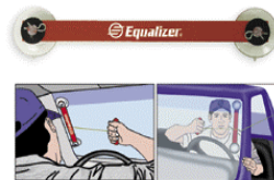
品番:GWH366 商品名:ワイヤーガード 参考価格:¥7,500