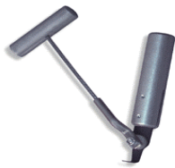
品番:GK380 商品名: コールドナイフ(ワイヤー) 参考価格:¥6,000