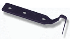
品番:PN1022 商品名: コールドナイフ替刃 (モールセーバー) 参考価格:¥5,400