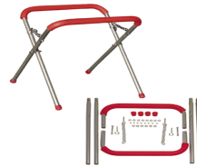
品番:HDK629 商品名: ガラススタンド(大型タイプ) 参考価格:¥19,000