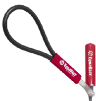
品番:LCK645 商品名:コールドナイフ 参考価格:¥8,000