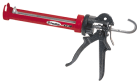
品番:CC-50 商品名:ハンドガン(26:1) 参考価格:¥10,000

* 参考価格につきましては為替変動等により異なる事があります * 下記以外の製品もお問い合わせ頂ければお取り寄せが可能です